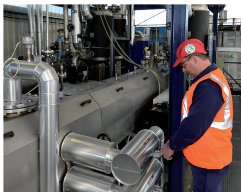
CHIMIREC PPM (37) : Régénération des huiles claires