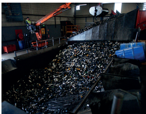
CHIMIREC Javené (35) : Valorisation des filtres à huile usagés