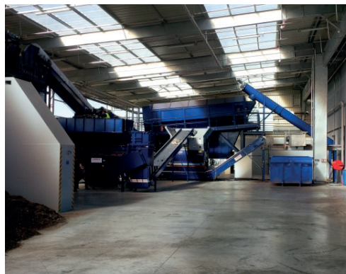
CHIMIREC Javené (35) : Préparation à base de Déchets Dangereux en vue de leur valorisation énergétique (Combustible de Substitution)