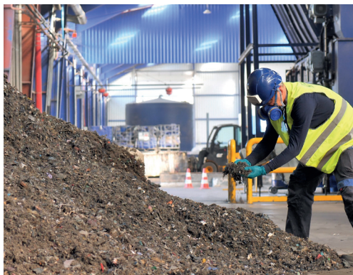
CHIMIREC Aulnay-sous-Bois (93) : Préparation à base de Déchets Dangereux en vue de leur valorisation énergétique (Combustible de Substitution)