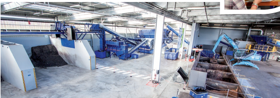
Préparation de déchets en vue de leur valorisation énergétique.