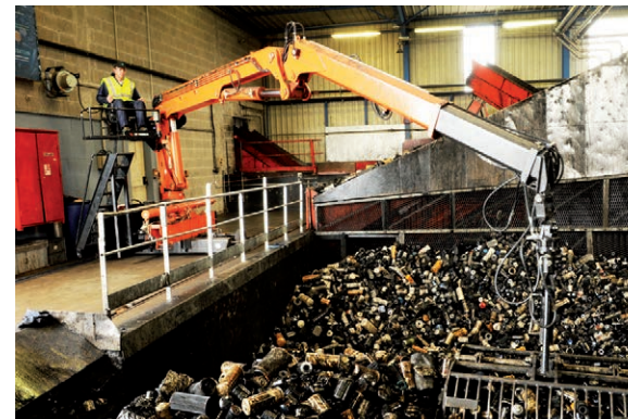
Traitement des filtres à huile