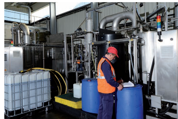
Régénération des liquides de refroidissement

> 80 % des déchets sortants sont valorisés*