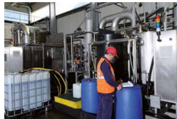
Régénération des liquides de refroidissement

> 80 % des déchets sortants sont valorisés*