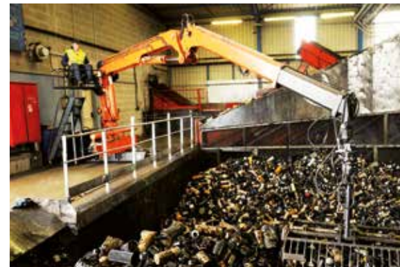
Traitement des filtres à huile